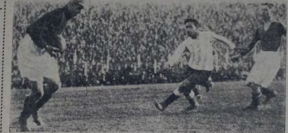
Arriba: El primer goal del partido, marcado después de un cabezazo de Mc Fadyen al rematar un centro del puntero derecho. Abajo: Una atajada del guardavalla escocés.